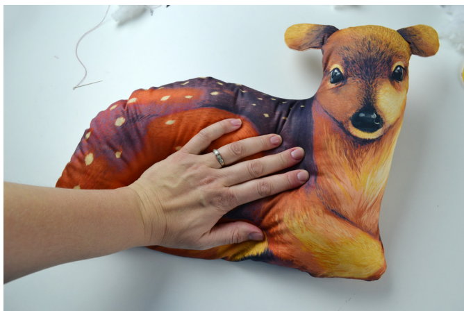
19/ Výplň pěkně „rozválíme“, aby neměla srnka boule.