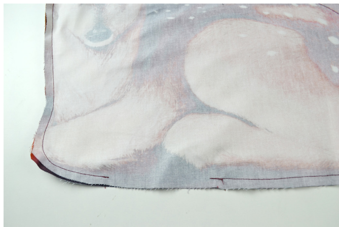
14/ Po obvodu díly sešijeme s vynecháním otvoru pro naplnění výplně.