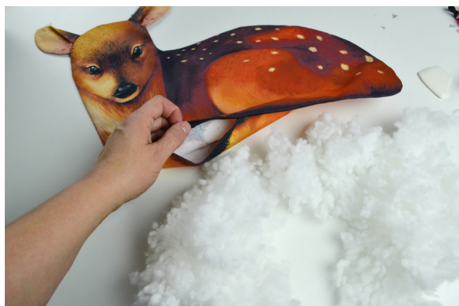
18/ Polštář naplníme.