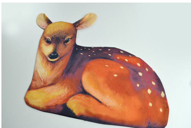
17/ Srnku otočíme a vyžehlíme.