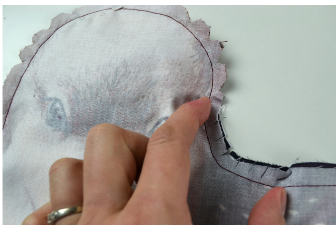
15/ Upravíme švové záložky nastřížením vnitřních rohů...