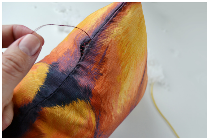
20/ Zašijeme skrytým stehem vynechaný otvor a máme hotovo:-).