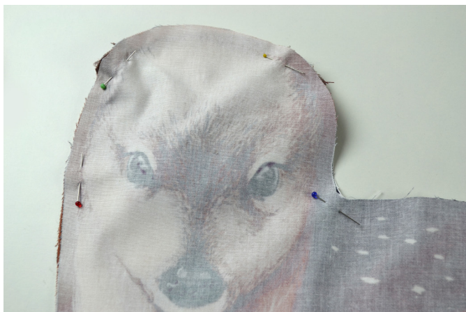
13/ ...a přikryjeme druhým dílem srnky. Díly sešpendlíme.