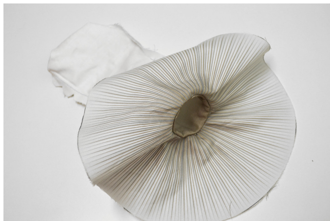
14/ Nožku vtáhneme do spodního klobouku (přetočíme ji do rubu).