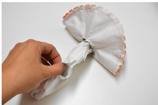
18/ Houbu přetočíme do líce vynechaným otvorem v nožce.