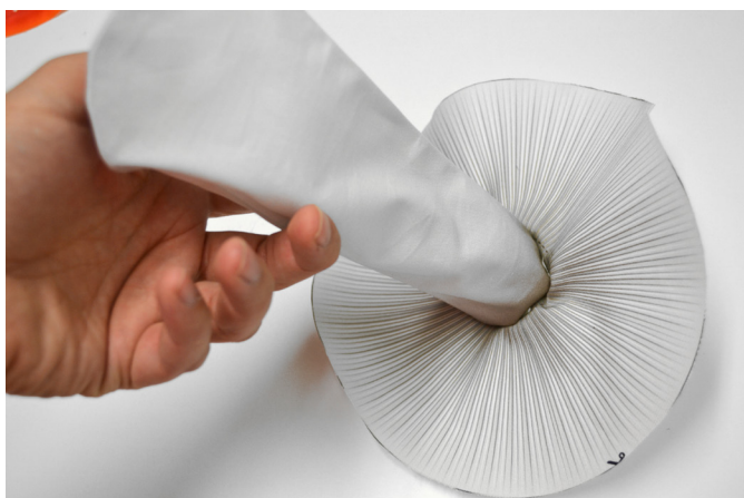
11/ Horní okraj nožky též několikrát ve švové záložce nástřihneme a nožku vložíme do spodního klobouku (pohled na lícni stranu).