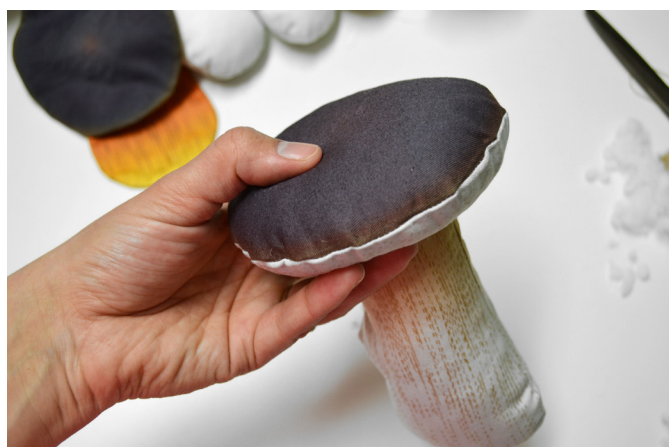
28/ U hříbu a suchohříbu klobouk plníme více a již jej neprošíváme.