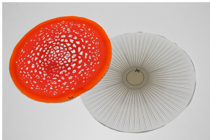
8/ Přichystáme si díly klobouku.