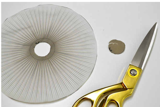
9/ U spodního klobouku vystříhneme vnitřní kolečko.