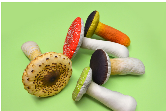
29/ A je hotovo:-)