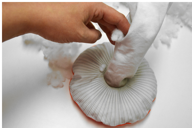
20/ Houbu naplníme výplní. Začneme od klobouku.