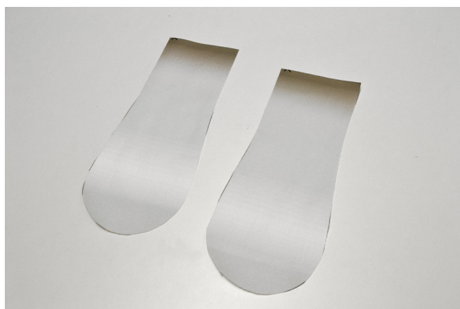
4/ Začínáme vypracováním nožky.