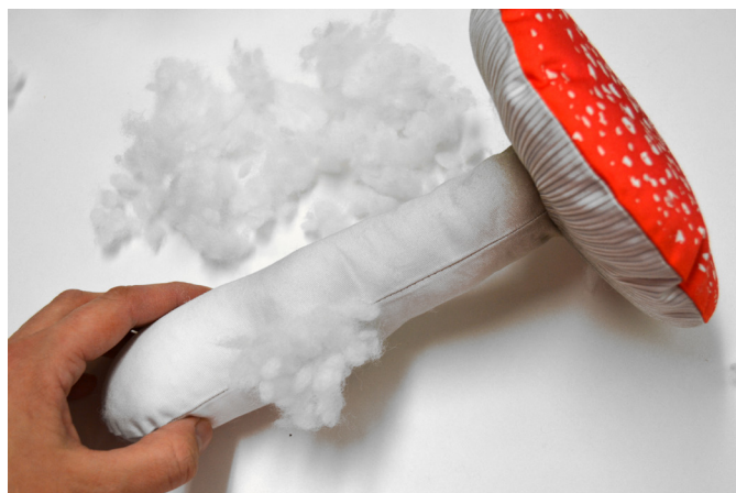
22/ Po naplnění klobouku začneme plnit nohu. Tu plníme hodně, aby pěkně držela tvar.