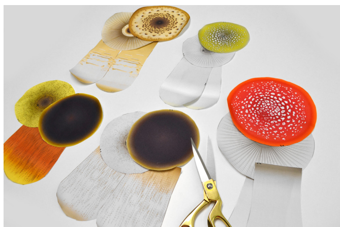
3/ Jednotlivé díly vystříhneme.