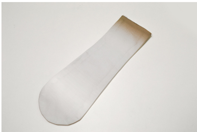
7/ Nožku otočíme do líce a vyžehlíme.