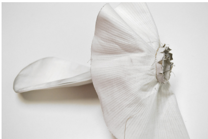
13/ Nožku všijeme (šijeme po vnitřní straně nožky).