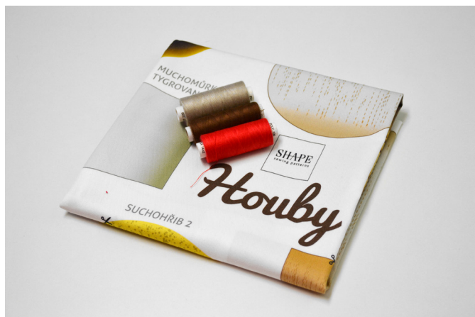
1/ Přichystáme si panel a nitě.