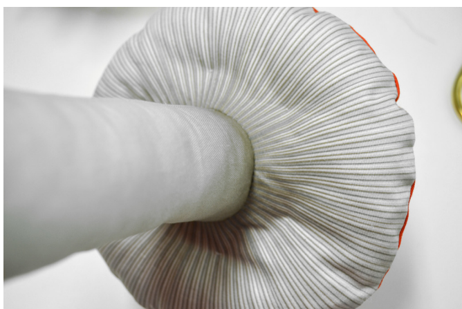
27/ Pohled na stehy na spodním klobouku.