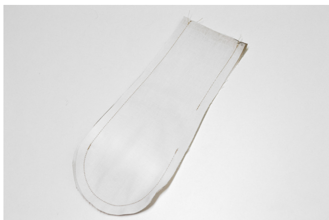
5/ Díly složíme lícem na líc a sešijeme za 0,75 cm (šíře švové záložky) s vynecháním otvoru.