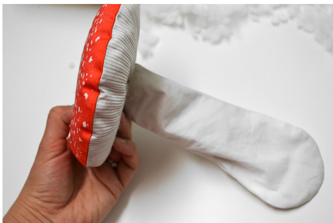
21/ Výplň pěkně rozprostřeme po celém klobouku.