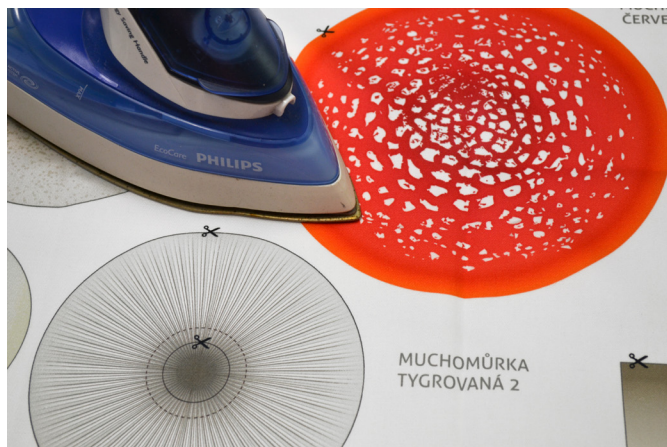
2/ Panel si vyrážíme žehlením s napařováním.