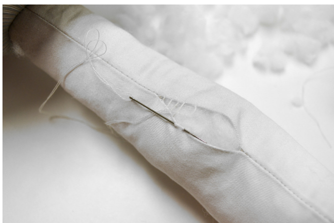
23/ Po naplnění zašijeme vynechaný otvor skrytým stehem.