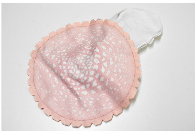
17/ Upravíme švovou záložku vystřiháním „V“,