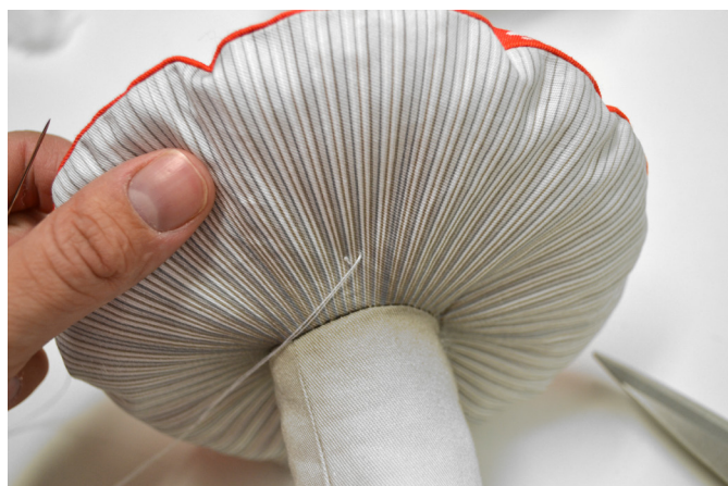
24/ U muchomůrek (obou) a bedly je potřeba prošít klobouk, aby se nerozevřel do výšky a byl pěkně placatý. Proto si navlečeme dvojitou nit v odpovídající barevnosti a klobouk na pár místech (cca 6ti) nenápadně prošijeme.