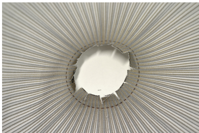
10/ Provedeme nástřihy švové záložky.