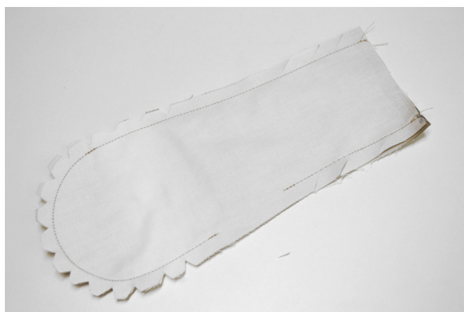
6/ Upravíme švové záložky vystřížením „V“.