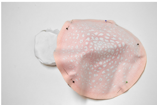
15/ Spodní klobouk přiklopíme vrchním kloboukem (lícem na líc).