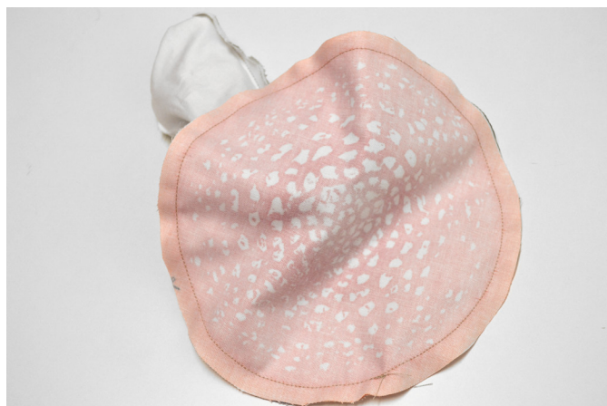
16/ Klobouky sešijeme (za 0,75 cm).