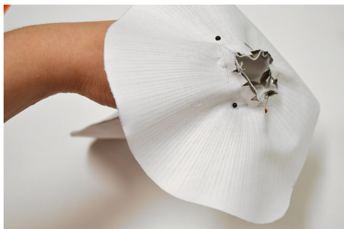
12/ Nožku vešpendlíme do otvoru a hlavně nastehujeme, aby nám díly při následném šití pěkně držely na svém místě.