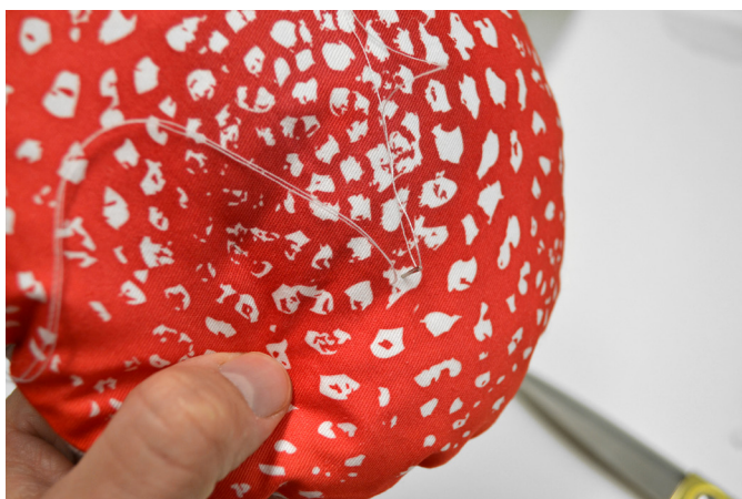
25/ Vždy prošijeme skrz krátkým stehem a když se chceme posunout dál, děláme to šikmým vedením stehu uvnitř klobouku. Prošítí lehce stahujeme.