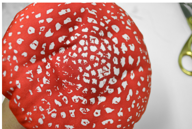
26/ Pohled na stehy na vrchním klobouku.